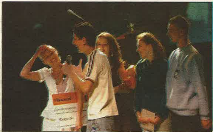
GLADE VINNERE: Bosnias representanter gikk til topps i den internasjonale versjonen av «The Cube Of Ibsen».

Fire unge filmentusiaster fra Stathelle hadde all mulig grunn til å være fornøyde i Ibsenhuset lørdag kveld.